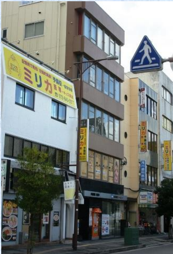
ミリカの校舎が立ち並ぶ大阪府茨木市の主要道路

成績を上げたい小学生・高校生・浪人生も同時募集中です。一度お越しいただき、塾長の無料面談から始めてください。